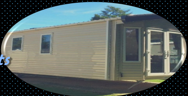
Mobile Caravan Units

ISM PREFAB provides mobile unit units on residential and office trailers for workers in permanent moving sites such as laboratories, specialized training centers, medical staff and oil field services companies, which move continuously from one site to another.