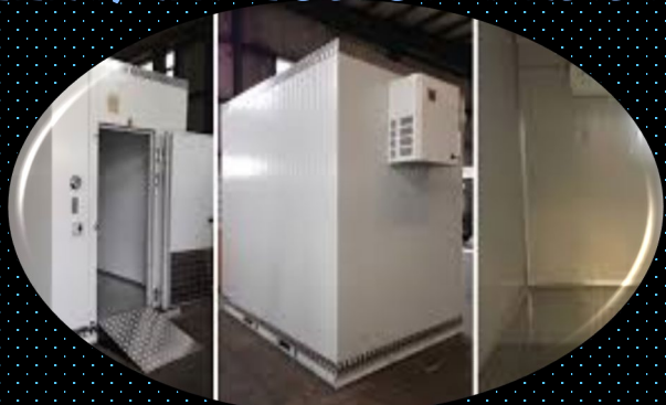
cold and freezer rooms

ISM PREFAB design & manufacture and install bullet/explosion resistant structures characterized by resistant walls with accurate specifications for high-risk sites in proportion to the nature of the site and the required resistance