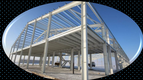
Workshop's & Warehouses

ISM PREFAB Fully customizable modified containers based on your requirements. With Heat-proof and waterproof design, Fully modular, can be moved and redeployed to other locations.