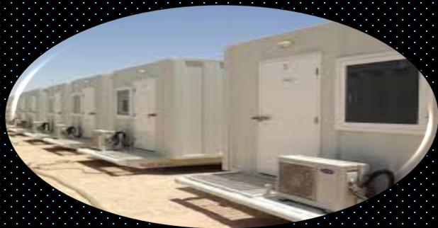
Skid Mount Rig Units

ISM PREFAB provides Skid mount units (residential - office - service) to serve the petroleum sectors, desert sites, oil extraction field, .Due to the special specifications such as: Withstand harsh environmental conditions, high temperatures, resistance to severe sand and dust storms, continuous and regular disassembly and assembly, and the possibility of transportation several times without violating specifications.