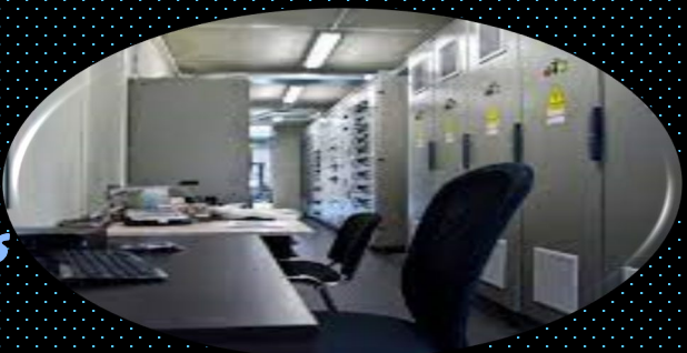
Electrical Control Rooms

ISM PREFAB offers High quality prefabricated control room. We manufacture these units according to the required technical specifications using high quality raw materials, moreover, these heavy duty portable or fixed products are manufactured individually or assembled according to the required spaces under