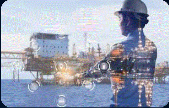
OIL & GAS FIELD